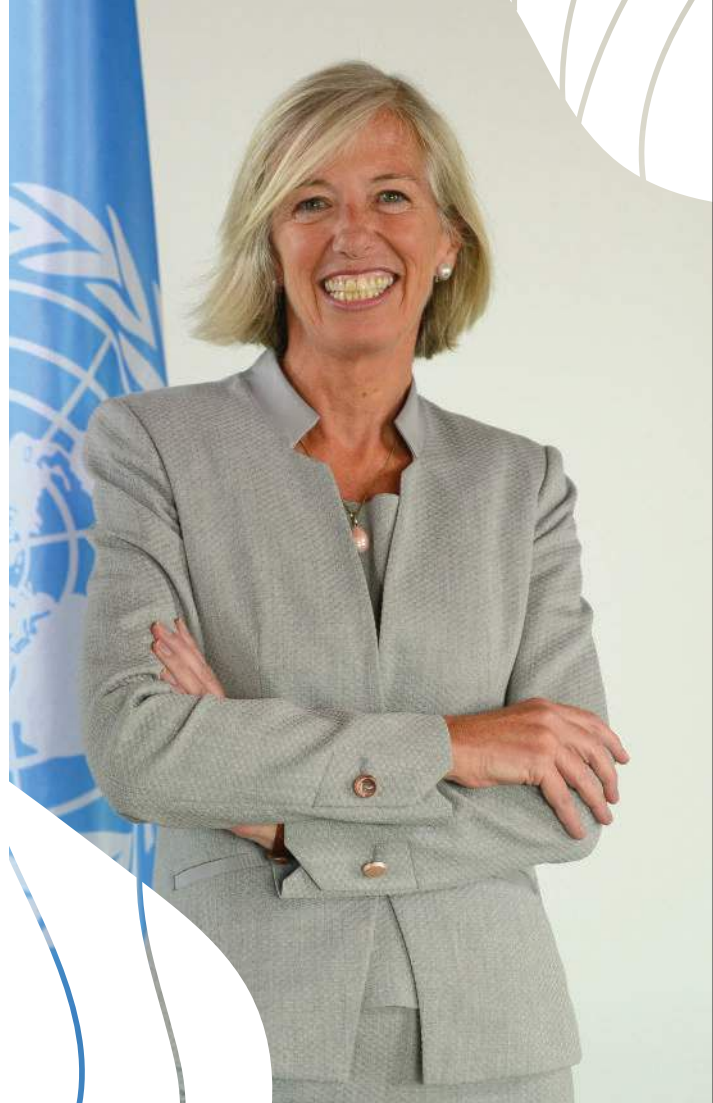
▲ Stefania Giannini, sous-directrice générale de l'UNESCO pour l'éducation

Tout progrès humain et social dépend de l'accès à l'éducation, et cela d'autant plus dans des sociétés du savoir interdépendantes confrontées à des défis communs. Passeport pour l'autonomisation, l'émancipation, la transformation individuelle et collective, l'éducation permet la prise de conscience. « Elle facilite la compréhension des enjeux et impulse une capacité d'agir de façon juste et altruiste en vue de dessiner des solutions. À cette fin, l'éducation elle-même doit être transformatrice, être un espace de liberté mais aussi de respect où se cultivent la pensée critique, l'empathie, l'ouverture à la diversité » ajoute Stefania Giannini.