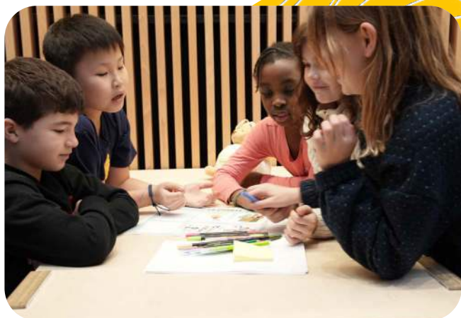
Atelier Bâtisseurs de Possibles autour du droit à l'éducation en co-animation avec la Mission des Droits de l'Enfant de la Ville de Paris

Paris, le 12 février 2024. Grâce à un temps fort de résonance autour de la Journée internationale de l'Éducation , le 24 janvier, le Learning Planet Institute et l' UNESCO ont renouvelé une programmation ambitieuse pour cette cinquième édition du LearningPlanet Festival . Celui-ci s'est tenu du 22 au 27 janvier, au sein du Learning Planet Institute, à Paris, ainsi que dans de nombreuses régions partenaires françaises et dans plus de 191 pays à travers le monde. Chaque année, cette dynamique mondiale d'échange de bonnes pratiques, de rencontres, de valorisation des enseignants et de milliers d'acteurs engagés dans une transformation de l'Éducation trouve un public engagé, passionné et curieux de continuer à apprendre, tout au long de la vie.